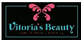
TABELA DE PREÇOS - 2023